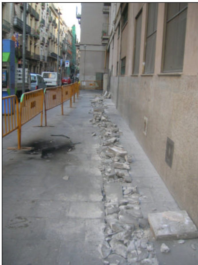
Fotografia 1: Inici obertura rasa100