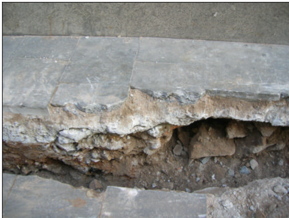
Fotografia 2: Detall de la secció rasa100 amb UE101, UE102 i UE103