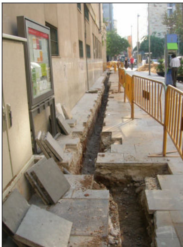
Fotografia 3: Rasa100 un cop rebaixat el sòl